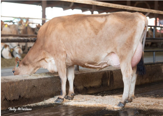
JX PROGENESIS MINNIE {5} DAM

JX PROGENESIS MONARCH {5} JX PROGENESIS MINNIE {5} VG-80%-2YR-USA JX VIERRA SINATRA {4} PROGENESIS MADISON EX-90%-3YR-USA JX RIVER VALLEY CHIEF {6} RACHELLES VICEROY LOUISE VG-88%-6YR-USA